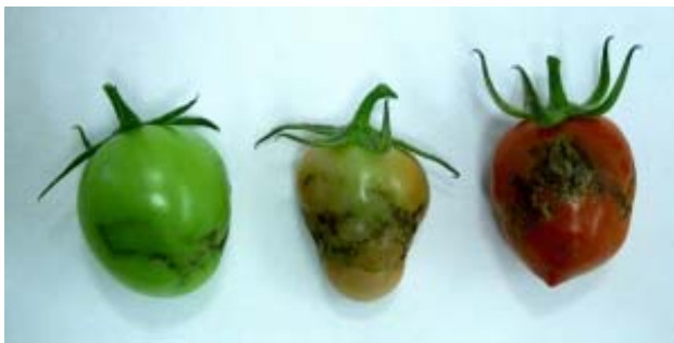
Foto 2. Fruchtsymptome des Tomato Mosaic Virus